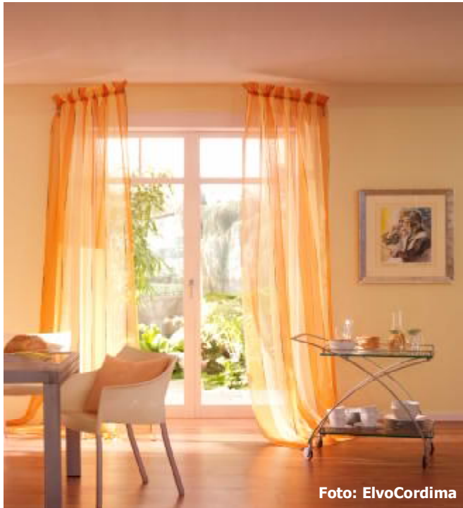
Sanfte Ton in Ton Variante.

Stoffe und Farben verändern Räume. Sie machen kleine Zimmer größer, schmale Räume breiter oder dunkle Wohnungen heller. Und natürlich verändern Stoffe und Farben auch die Stimmung der Menschen, die in diesen Räumen leben und arbeiten. Manche fördern die Entspannung, andere lassen es lebhafter zugehen. Mit Stoffen und Farben lassen sich also eine ganze Menge Atmosphäre in die eigenen vier Wänden zaubern – vorausgesetzt, man beherrscht ein paar wenige Grundkenntnisse und Regeln.